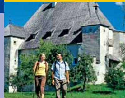
Casa nobile Glurnhär a Castel Badia presso San Lorenzo