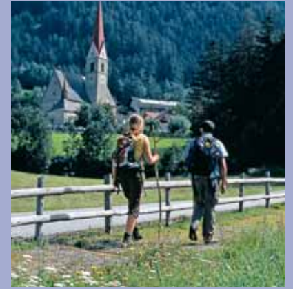
Maria Trens a Campo di Trens

troviamo affreschi rappresentanti l'apostolo su due facciate di case private (una in Via Geizkofel, l'altra sulla statale in direzione di Colle Isarco). La casa dell'Ordine Teutonico nelle immediate vicinanze della bellissima Parrocchiale (il primo pilastro a sinistra è stato donato dalla congregazione di San Giacomo) e la "stube" dell'Ordine di San Giovanni nella città vecchia (nell'ex-cappella dell'ospizio) sono tuttora testimoni di queste due importantissime congregazioni cavalleresche presenti in tutta Europa. Nello stemma della città ritroviamo la leggendaria figura del "Sterzl" un pellegrino devoto con rosario che si regge su stampelle. Secondo una leggenda fu probabilmente lui a dare il nome alla città, in tedesco "Sterzing".