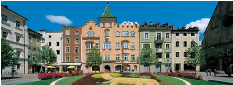
Piazza Duomo a Bressanone con il Municipio

circa mezz'ora di cammino verso sud possiamo ammirare il Duomo, l'annesso chiostro, la chiesa di San Giovanni, il Palazzo Vescovile e il vecchio cimitero, una carrellata di stili architettonici diversi dal romanico al tardo-barocco raggruppati in uno splendido e magnifico spazio ristretto. Ma ora torniamo sui nostri passi sul Cammino. Dopo l'Abbazia attraversiamo il vecchio ponte sull'Isarco, svoltiamo a destra e raggiungiamo il