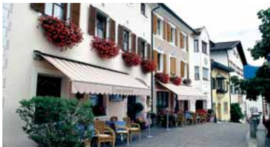
Rio di Pusteria

Una chiesa dedicata a San Giacomo non necessariamente deve trovarsi direttamente sul Cammino. Ne troviamo un esempio se saliamo di qualche metro da Vandoies di Sotto su verso la chiesa di San Giacomo a Maranza. Sulla parete esterna veniamo accolti dal secondo grande patrono dei viandanti, da San Cristoforo, che, come a Nasen, viene raffigurato in mezzo