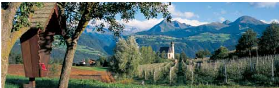
Altipiano delle mele Naz-Sciaves: chiesetta di S. Maddalena a Fiumes

al mare attorniato da strane creature. (Si racconta che chi muore proprio il giorno nel quale ha visto San Cristoforo, attraverserà indenne il purgatorio per arrivare direttamente in Cielo. Questo spiega anche le rappresentazioni monumentali sulle pareti esterne delle chiese. Chiunque poteva vedere già da lontano il Santo, sia esso stato viandante o un bracciante che si recava nei campi.) Il sentiero nel fondovalle – lungo la ciclabile – ci porta fino alla Chiesa di Rio di Pusteria, che il Conte Sigismondo del Tirolo fece costruire nel 1472, con lo stesso intento delle chiese di Lienz e del Castello di Brunico, cioè il controllo delle strade e delle merci trasportate. Nel 1809 la chiesa fu testimone di una cruenta battaglia all'epoca delle guerre di liberazione del Tirolo. Oggi le antiche mura sono restaurate e convertite a luogo di cultura per soli scopi "pacifici".