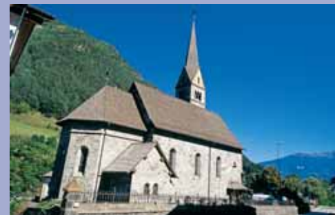
Chiesa Parrocchiale di Fortezza

sentiero no. 1, che superando la statale e l'autostrada ci porta al laghetto di Varna. Costeggiando il laghetto sul lato est percorriamo parallelamente all'autostrada la ciclabile fino a raggiungere Fortezza. Il paese deve il suo nome all'imponente fortezza voluta dall'Imperatore austriaco Franz I, costruita tra il 1833 e il 1839. Una fortezza che non è mai stata utilizzata per attività bellicose.