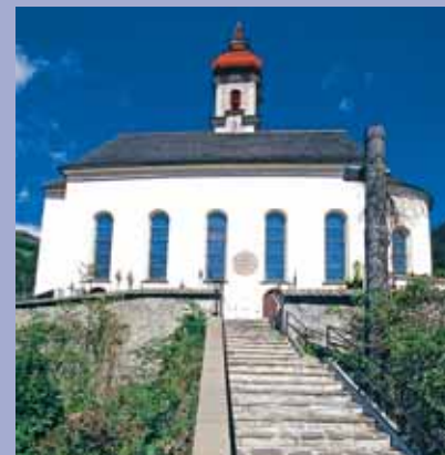
Chiesa Parrocchiale di Colle Isarco

ma del paese Brennero troviamo un sentiero (sulla riva destra) che ci porta verso l’installazione moderna e mistica al contempo (“84 scalini”). Alla fine della scalinata si trova un piccolo bunker del tempo della Seconda Guerra Mondiale. Da qui si gode di un panorama eccezionale. Il passo del Brennero non solo è uno dei passi alpini più trafficati, ma ha vissuto in passato una storia movimentata. Un luogo magico, che emana un’atmosfera romantica e dura nel contempo. Milioni di pellegrini, commercianti, soldati, papi, re, imperatori e turisti in cerca del sole mediterraneo hanno superato il passo del Brennero, uno dei passi più bassi delle Alpi. La Parrocchiale tardo-gotica (XIV secolo, il coro risale ancora a quell’epoca) è dedicata a San Valentino, santo di origine retica, pellegrino e patrono della salute. Il luogo ideale per dare l’addio ad un bellissimo tratto del Cammino di Santiago attraverso l’Alto Adige.