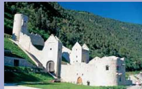
Chiesa di Rio di Pusteria