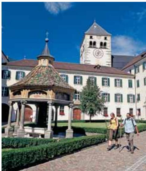
Cortile interno dell'Abbazia di Novacella

circa mezz'ora di cammino verso sud possiamo ammirare il Duomo, l'annesso chiostro, la chiesa di San Giovanni, il Palazzo Vescovile e il vecchio cimitero, una carrellata di stili architettonici diversi dal romanico al tardo-barocco raggruppati in uno splendido e magnifico spazio ristretto. Ma ora torniamo sui nostri passi sul Cammino. Dopo l'Abbazia attraversiamo il vecchio ponte sull'Isarco, svoltiamo a destra e raggiungiamo il