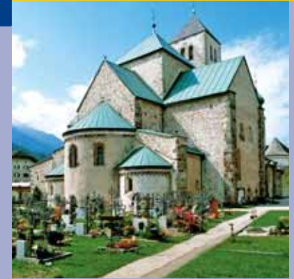
Chiesa della Collegiata di San Candido