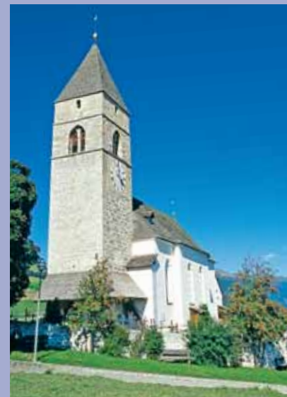
Chiesa di S. Giacomo a Maranza

luogo di pellegrinaggio locale – soprattutto le domeniche di Quaresima – ci induce a soffermarci. Sopra Aica (chiesa tardo-gotica di San Nicolò) raggiungiamo il nuovo sentiero lungo il lago artificiale di Fortezza, che ci porta fino in paese, dalla fine del XIX secolo un importante nodo ferroviario. Chi desidera visitare Novacella e Bressanone, di motivi per una visita ce ne sono tanti, scende dalla stazione V della Via Crucis verso sinistra, superando su un ponte la statale per arrivare a Sciaves. Sul sentiero no. 8, poi seguendo