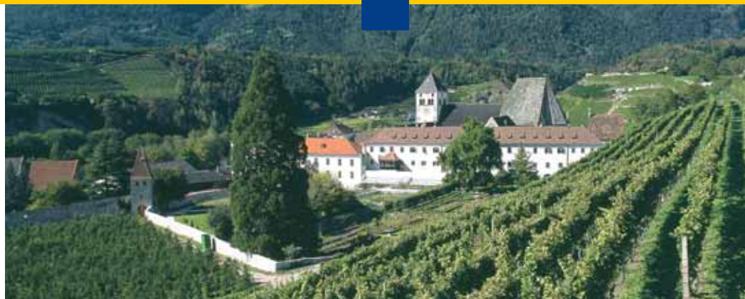
Abbazia di Novacella

Il pellegrinaggio, il cammino è l'espressione di un fenomeno esistenziale prettamente umano. Soprattutto nella Parola della Bibbia nel Testa-